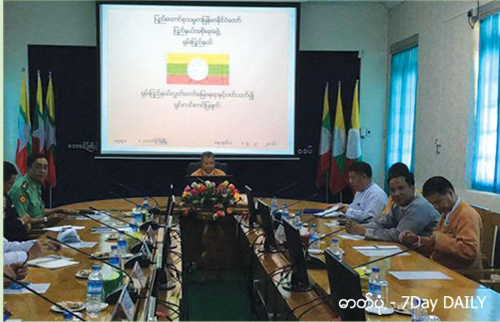
တတိပ် - 7Day DAILY