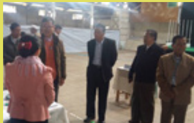
အောက်တိုဘာ ၉ ရက်နေ့ ချင်းပြည်နယ် တားခါးမြို့နယ်စည်ပင်ရွေးကောက်ပွဲသို့ ပြည်နယ်ဝန်ကြီးချုပ်နှင့် လွှတ်တော်ဥက္ကဋ္ဌ ဦးစိုဘွဲ့ လှည့်လည်ကြည့်ရှုစဉ်။