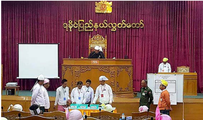
မဲရေတွက်နေသည်ကို ကြည့်ရှုနေသော ဝန်ကြီး ဦးမင်းအောင်(ပင်နီတိုက်ပုံဝတ်ထားသူ)ကို တွေ့ရစဉ်။