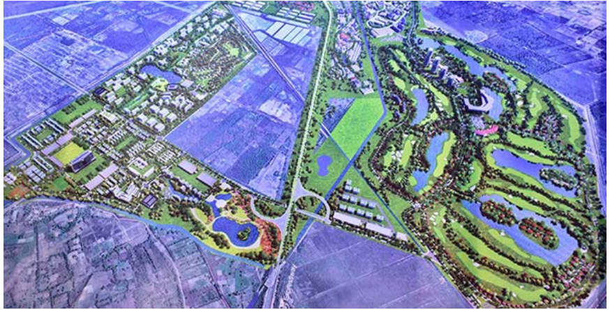
Eco Green City အိမ်ရာစီမံကိန်းပြ ဝင်ပုံ

လှည်းကူးမြို့နယ်အတွင်း ရန်ကုန်-မန္တလေး အမြန်လမ်း ၃ မိုင် ၁ ဖာလုံအနီး မြေဧက ၁,၄၅၃ ပေ တွင်တည်ဆောက်မည့် Eco Green City အိမ်ရာစီမံကိန်းကို ဥပဒေ နှင့်ညီညွတ်မှု ရှိ၊ မရှိ စိစစ်နိုင်ရန် တိုင်းလွှတ်တော်ဥပဒေရေးရာနှင့် လေ့လာသုံးသပ်ရေးအဖွဲ့သို့ တင်ပြထားသည်။ လွှတ်တော်၌လည်း မေးခွန်းမေးမည်ဟု ရန်ကုန်တိုင်းလွှတ်တော် ဘဏ္ဍာရေး၊ စီမံကိန်းနှင့်စီးပွားရေးကော်မတီထံမှ သိရသည်။