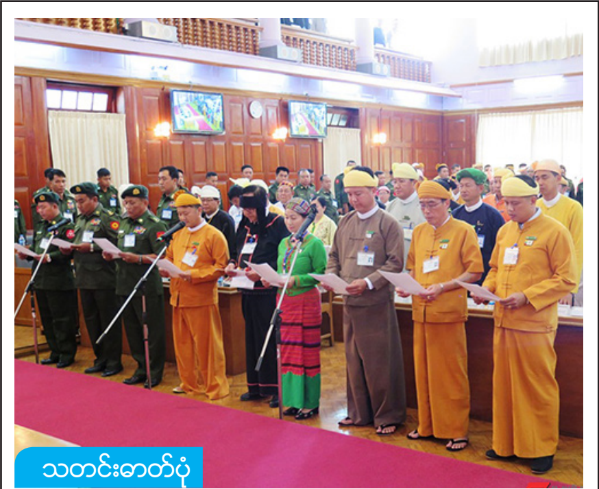
သတင်းဓာတ်ပုံ

ဖွန်လ ၆ ရက်၊ ရှမ်းပြည်နယ်လွှတ်တော် ဆဋ္ဌမပုံမှန်အစည်းအဝေး ပထမနေ့တွင် ကြားဖြတ်ရွေးကောက်ပွဲအနိုင်ရ ရှမ်းပြည်နယ်လွှတ်တော်ကိုယ်စားလှယ်သစ်(၆)ဦးနှင့် ပြောင်းလဲခန့်အပ်ခဲ့သည့် တပ်မတော်သားကိုယ်စားလှယ်သုံးဦးတို့ ကတိသစ္စာပြုစဉ်။