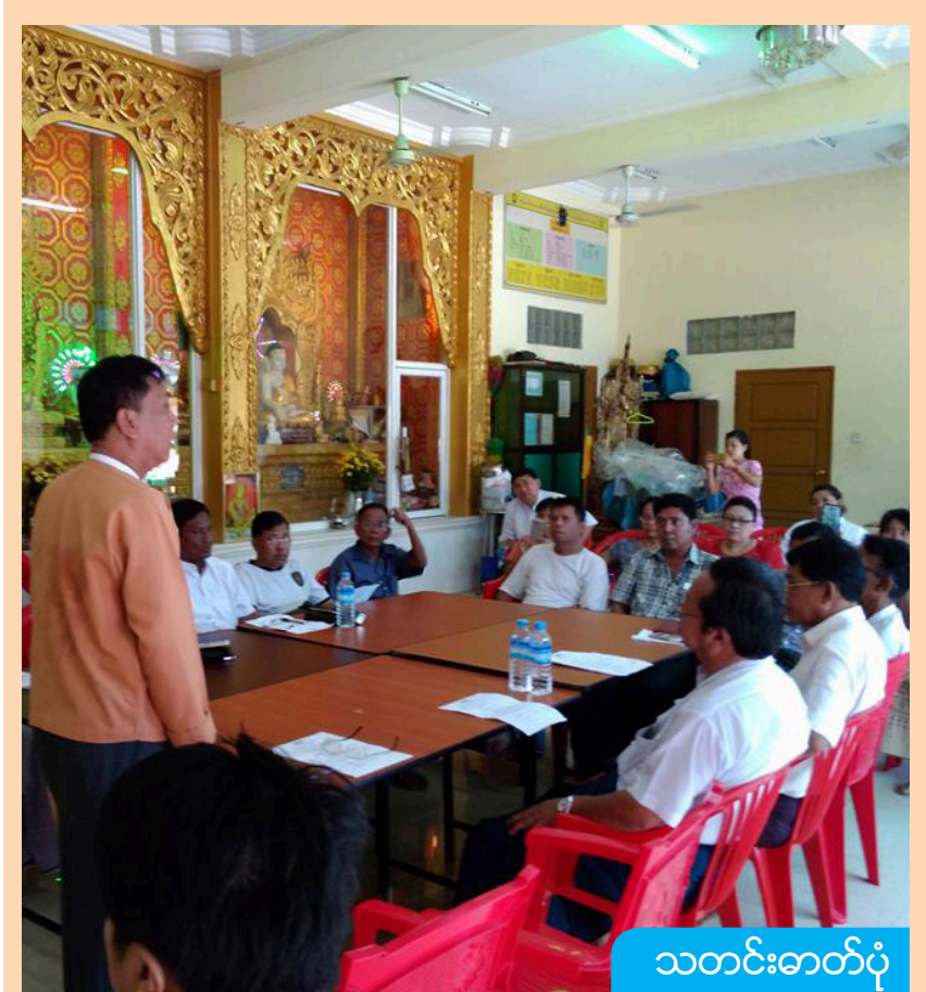
သတင်းဓာတ်ပုံ

နာရီကန်/တောင်ရပ်ကွက် ထီးတန်းမော့ရုံ၊ မင်္ဂလာတောင်ညွန့်မြို့နယ်တွင် ရန်ကုန်တိုင်းဒေသကြီး လွှတ်တော်ကိုယ်စားလှယ်များနှင့် ဒါနရှေ့ဆောင်မြန်မာအဖွဲ့တို့ပူးပေါင်း၍ ရန်ကုန်မြို့တော်စည်ပင်သာယာရေး ရွေးကောက်ပွဲဆိုင်ရာ လူထုတွေ့ဆုံပွဲကို ကျင်းပစဉ်။