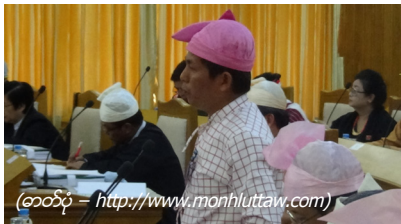
(ဘေဘို - http://www.monhluttaw.com )

၂၀၁၀ ပြည့်နှစ်မှ ၂၀၁၅ ခုနှစ် ပထမအကြိမ် လွှတ်တော် နှင့် ၂၀၁၆ မှ ယခုအထိ ၈ ရက်ထိပြုလုပ်သည့် လွှတ်တော်အစည်းအဝေးအထိ ယခင်အစိုးရနှင့် ယခုအစိုးရသစ်ပါ ဆက်စပ်သောစည်းမျဉ်းစည်းကမ်း၊ အမိန့်