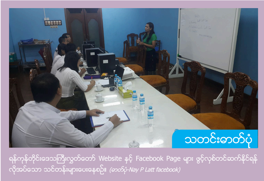
သတင်းဓာတ်ပုံ

ရန်ကုန်တိုင်းဒေသကြီးလွှတ်တော် Website နှင့် Facebook Page များ ဖွင့်လှစ်တင်ဆက်နိုင်ရန် လိုအပ်သော သင်တန်းများပေးနေစဉ်။